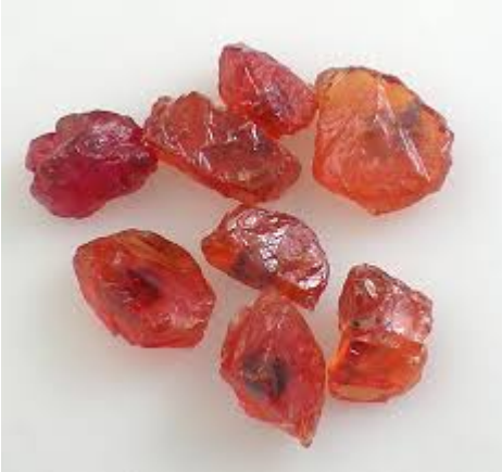
Orange / rosa Farbvariationen des Saphir